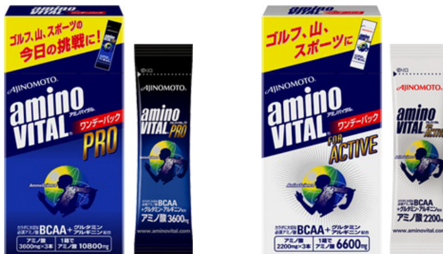
アミノバイタル® ワンデーバック プロ 3本スティック入箱

5月26日(土)、27日(日) 090-6172-3210 090-6547-2791